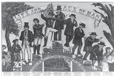
3 קורייר ואייבס, "חיי וגילי גבר", 1857 (תיארוך לא מדויק)