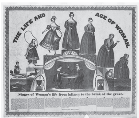
2 אלברט אלדן, "חיי וגילי אישה", 1835 בקירוב

חיים מפורטים יותר, הכוללים 11 שלבים. הגבר מגיע לגיל 100, ואילו האישה מגיעה לגיל 90, וזה מצב הפוך לכל עובדה ביולוגית וסטטיסטית מוכרת, שעל פיה נשים מאריכות ימים יותר מגברים. סימון זה בובואר מתייחסת גם היא להדפסים הללו ומצביעה על עובדה מוזרה, לדעתה: "גם עכשיו [הספר יצא לאור בשנות ה־70 של המאה ה־20] זה בלתי רגיל לאנשים להגיע לגיל 100, והדבר היה אפילו נדיר יותר אז. התמונות האלה לא היו קשורות לחיים האנושיים כפי שהיו במציאות האפשרית, אלא בביסוס סוג של ארכיטיפ. לפסימיזם שלהן היה מקור בנצרות; האדם, נדון לנבילה עצובה, חייב מעל הכול להסתכל על ישועתו, גם בזמנים של שגשוג". 42