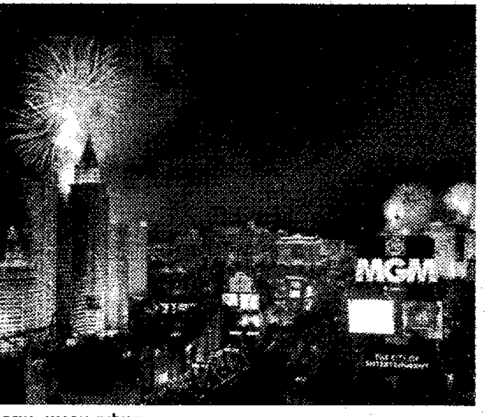
תצלום ארכיון. איפיו