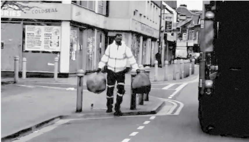
איור 1.7 | איסוף אשפה בסיטי רוד