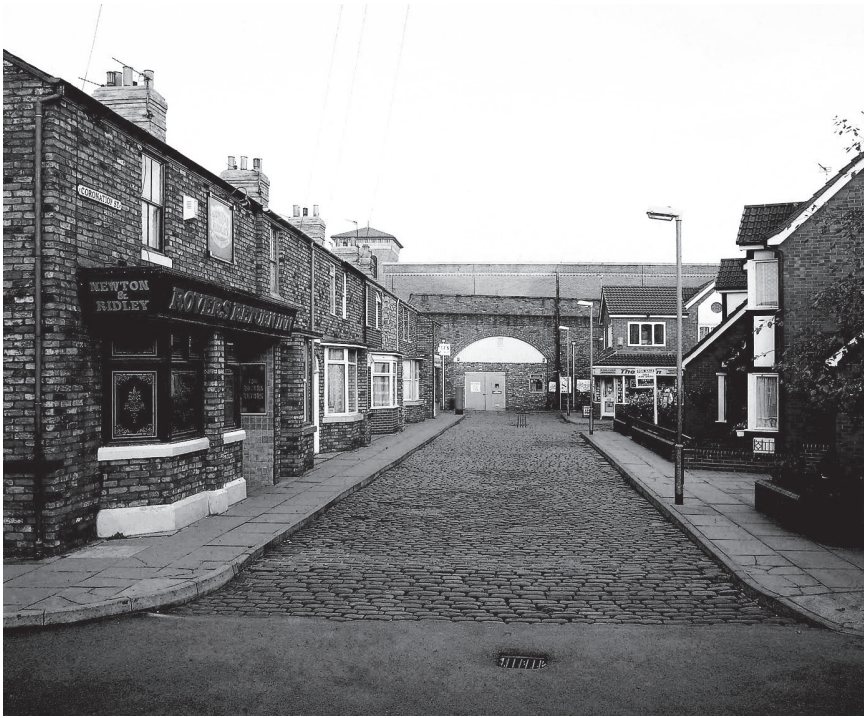
איור 1.4 | שיכונים חדשים ושיכונים ישנים בקורוניישן סטריט

דיון מפורט בשכונות יובא בחלקו השני של הספר, בפרק 6.