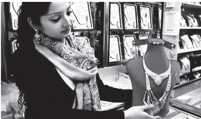
איור 1.8 | חנות הסארי (ביגוד הודי) בסיטי רוד

עיצוב החברה ועיצובה מחדש אינם מתנהלים ללא תקלות. תמיד יכולים להתרחש אירועים המשבשים את שגרות החיים ואת ההתנהגויות הצפויות של בני האדם ומחייבים אותם לנקוט צעדים לתיקונם, כמו תאונות דרכים, סכסוכי שכנים או אולי אירוע בקנה מידה גדול יותר, כדוגמת המשבר הכלכלי של 2008. שיבושים אלו