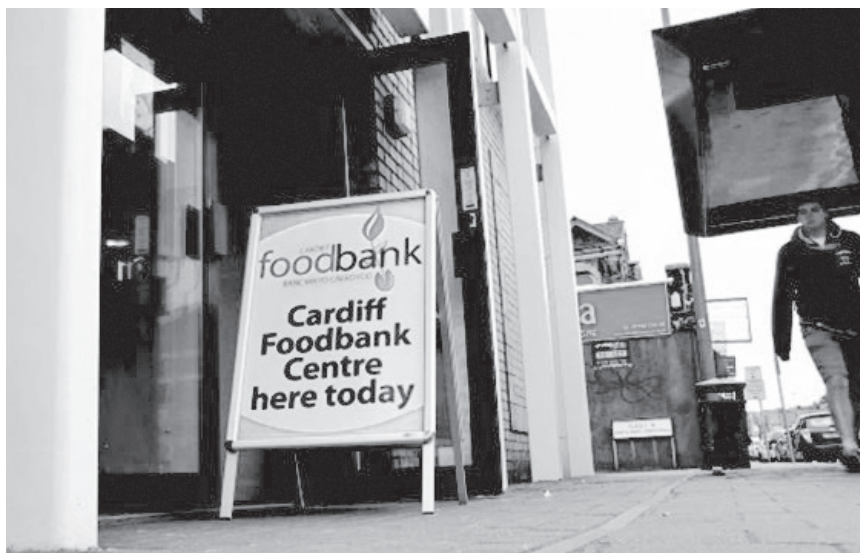
איור 1.9 | עמותה חלוקת המזון

מחנניות אחרות בסיטי רוד. אנשים מבוגרים מרגישים רצויים בקפה טייסט באדס, אך הם עשויים להרגיש רצויים פחות באולם הביליארד לא משום שאולם הביליארד מדיר בידועין את הקשישים, אלא פשוט משום שתוכנן למשוך קבוצות מסוימות של אנשים.