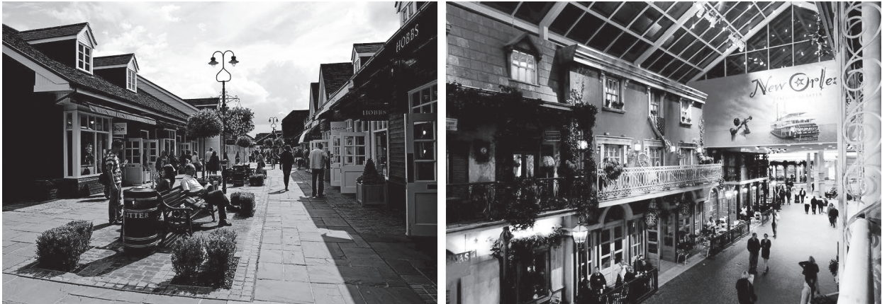
איור 1.2 | "ביסטר שופינג וילאג" ו"טרפורד סנטר"

כותרות מעין אלו מספקות לנו מידע מגוון בנוגע למקומות שבני אדם מתגוררים בהם, לסוגי בני האדם המתגוררים בהם ולשאלה כיצד עשויים להיראות חייהם. זו הסיבה לכך שהרחוב משמש לנו זה זמן רב נקודת מוצא שממנה מתחילים לשאול שאלות על אופייה של החברה ועל הדרכים שאנשים חיים בהן את חייהם. רחובות הם חלק מוכר של החיים החברתיים העכשוויים מכמה בחינות. הם מיוצגים במשחקי לוח מסורתיים, כמו מונופול, במשחקי מחשב, ביישומונים ובתכניות טלוויזיה. אופרת הסבון קורוניישן סטריט, המבוססת על רחוב עירוני בפרבר בדיוני ששמו ותרפילד בעיר האמיתית מנצ'סטר שבצפון אנגליה, תופסת מקום קבוע בראש טבלאות הצפייה באנגליה לצד התכנית המתחרה איסטאנדרט המתרחשת בלונדון, והיא חלק בלתי נפרד משגרת השבוע של אנשים רבים. גם אם אינך צופה בה בעצמך, ככל הנראה יש לך ידיד, קרוב משפחה או עמית לעבודה העושה זאת. דגמים של רחובות מצויים גם בקניונים כמו "ביסטר שופינג וילאג" באוקספורדשייר או "טרפורד סנטר" במנצ'סטר.